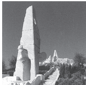
耕三寺の「未来心の丘」