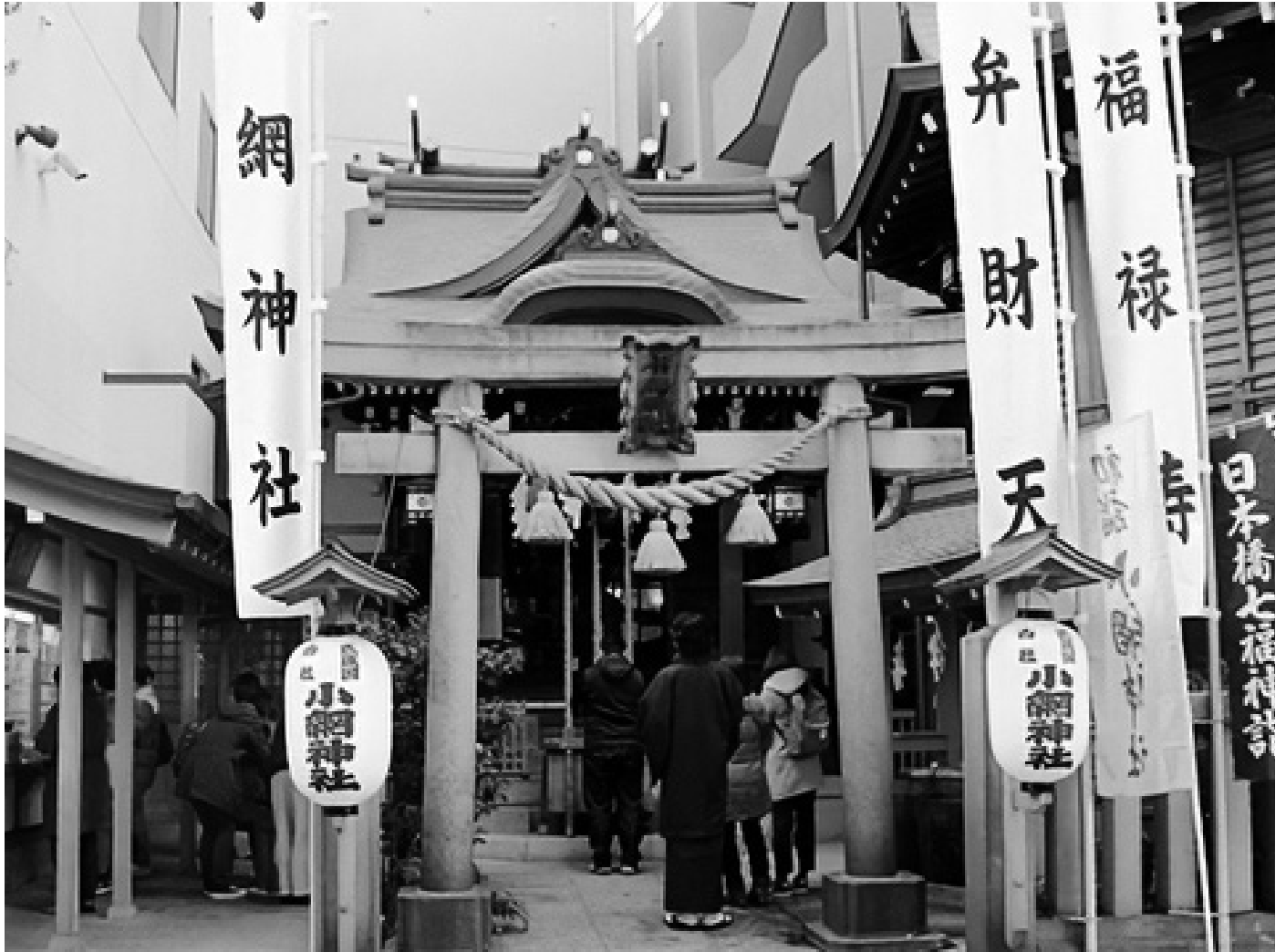
日本橋・小網神社(東京銭洗弁天)。

小さな神社ですが、財運向上や強運厄除のご利益を頂けるパワースポットとして有名で、全国から参拝する者が絶えません。