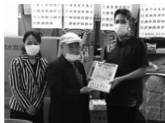
2021.11 沖縄市飲食業組合

税を考える週間を通して、沖縄中部間税会の会員はもとより、関係各位の皆様の健全な経営発展に寄与していくことが出来るよう、今後も取り組んでいきたいと思っています。