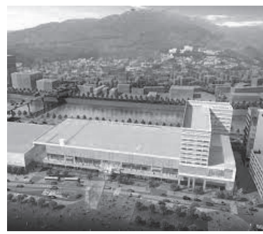
全間連第49回通常総会長崎大会 令和4年9月9日(金)出島メッセ長崎