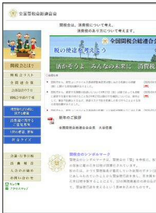
全国間税会総連合会ホームページ