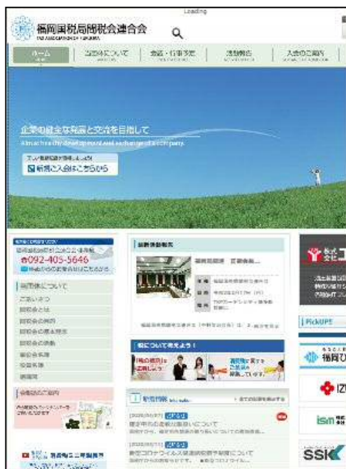
福岡国税局間税会連合会ホームページ

31の単位会を6ブロックに分けて、北九州地区では、小倉間税会、八幡間税会、若松間税会、門司間税会、行橋間税会の5単位会で構成される「北九州ブロック間税会連絡協議会」で、交流を深めています。