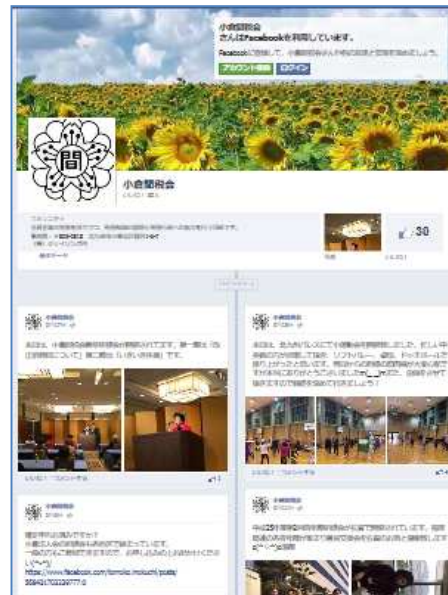
小倉間税会 facebook ページ