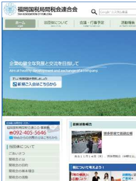
福岡国税局間税会連合会ホームページ

31の単位会を6ブロックに分けて、北九州地区では、小倉間税会、八幡間税会、若松間税会、門司間税会、行橋間税会の5単位会で構成される「北九州ブロック間税会連絡協議会」で、交流を深めています。